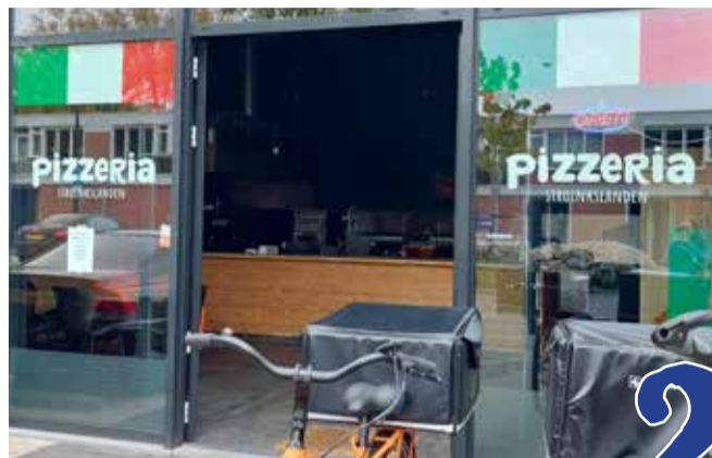
Nieuwe Pizzeria geopend in WC Het Stroink