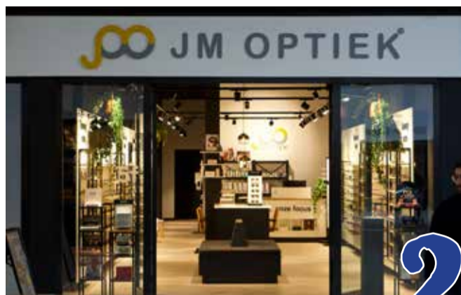
Even binnenkijken bij JM Optiek